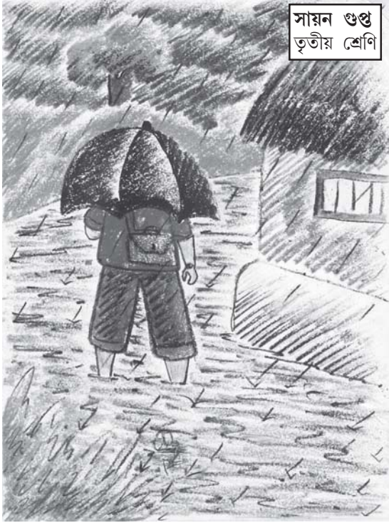
সায়ন গুপ্ত তৃতীয় শ্রেণি